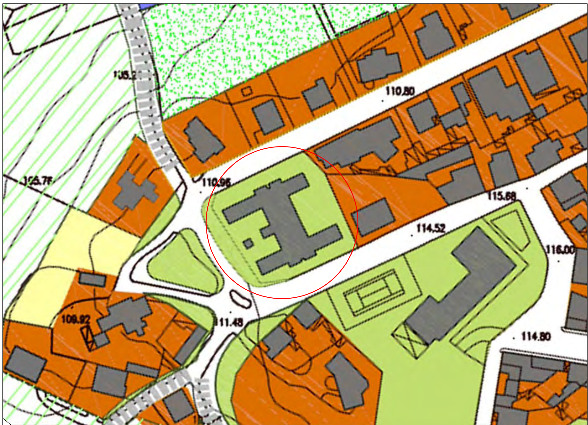
STRALCIO P.U.C. VIGENTE ZONA "S" scala 1:1.000