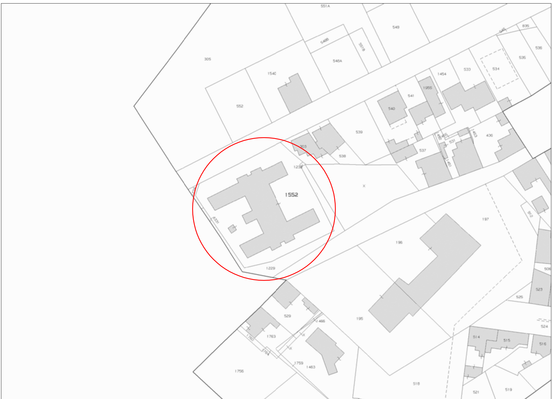
STRALCIO E.D.M. CATASTALE FOGLIO 504 MAPPALE 1552 scala 1:1.000