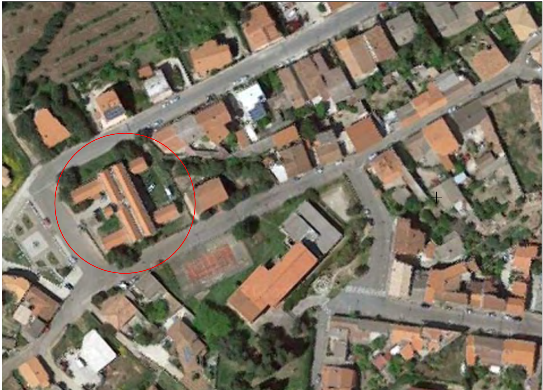
STRALCIO IMMAGINE SATELLITE scala 1:1.000